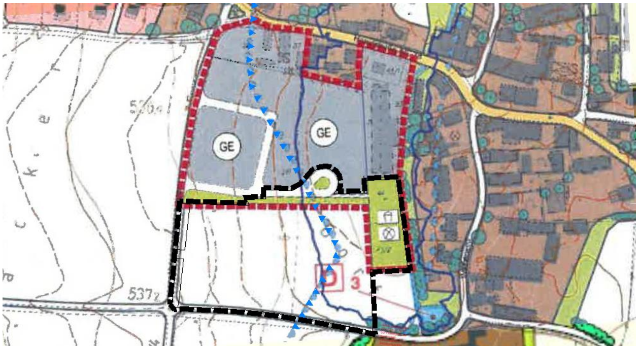
Abbildung 2: 5. Änderung des Flächennutzungsplanes der Gemeinde Steindorf mit Geltungsbereich der 12. Änderung (schwarz)