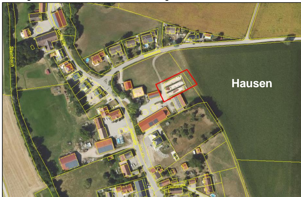
Abb.1: Luftbild Umgriff Änderungsgebiet

Im Rahmen der konkreten technischen Objektplanung für die neuen Gebäudestrukturen im Bereich des Satzungsgebietes der Einbeziehungssatzung „OT Hausen - Birkenweg“ hat sich nun aber gezeigt, dass die in der bereits beschlossenen Einbeziehungssatzung enthaltene östliche Randeingrünung aufgrund von bautechnischen Zwängen in den Bereich des Grundstückes Flur Nr. 211 verschoben werden muss. Demzufolge ist die Eigentümerin der Grundstücke Flur Nrn. 45 und 211, jeweils Gemarkung Hausen, nochmals mit dem Antrag auf eine entsprechende Änderung der Einbeziehungssatzung „OT Hausen - Birkenweg“ an die Gemeinde Steindorf herangetreten.